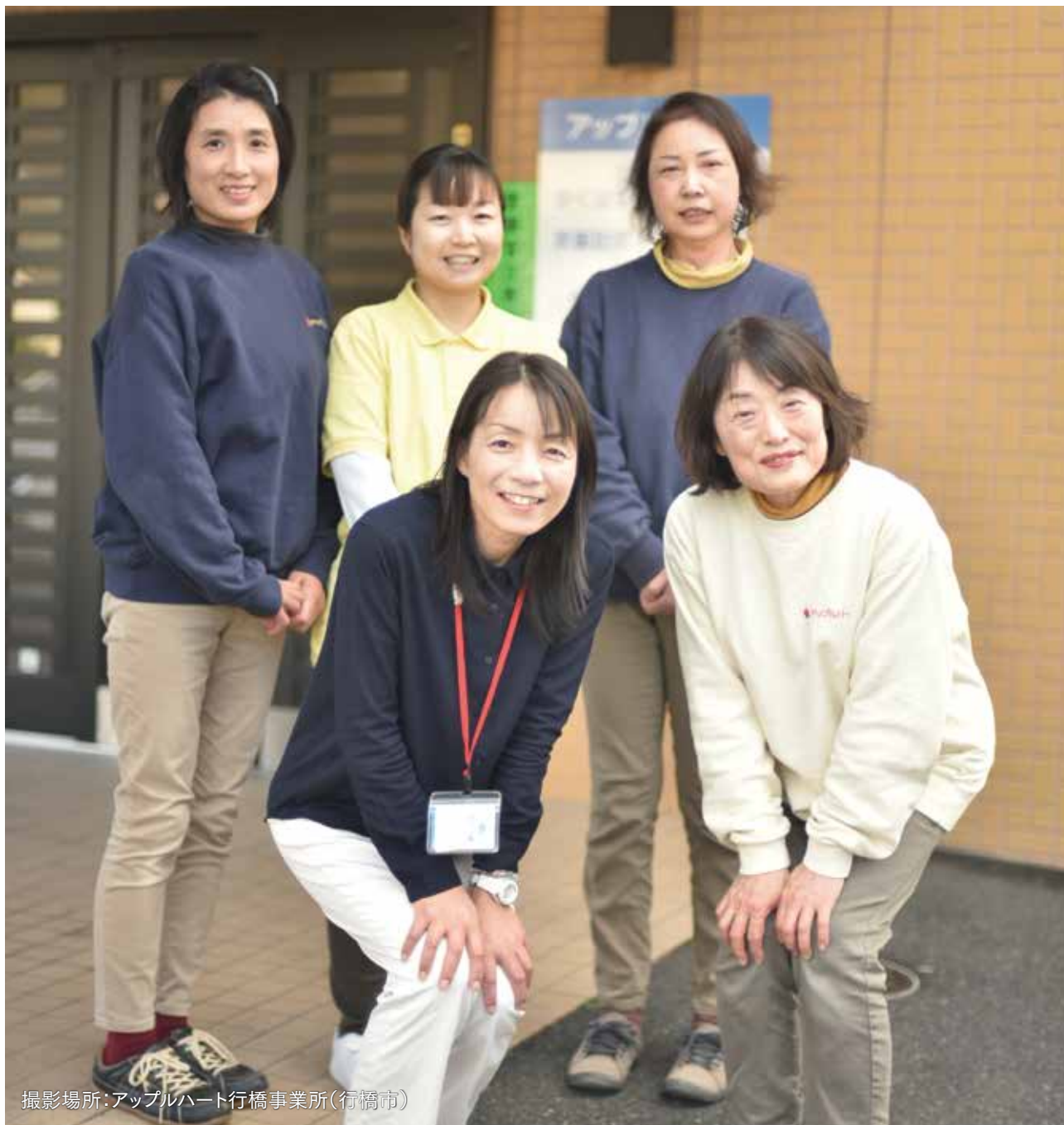
撮影場所:アップルハート行橋事業所(行橋市)